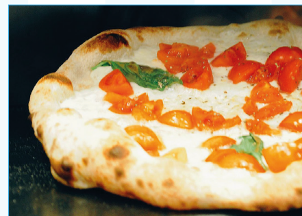
Coperto € 2.00