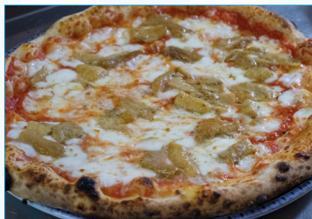
* Prodotto congelato